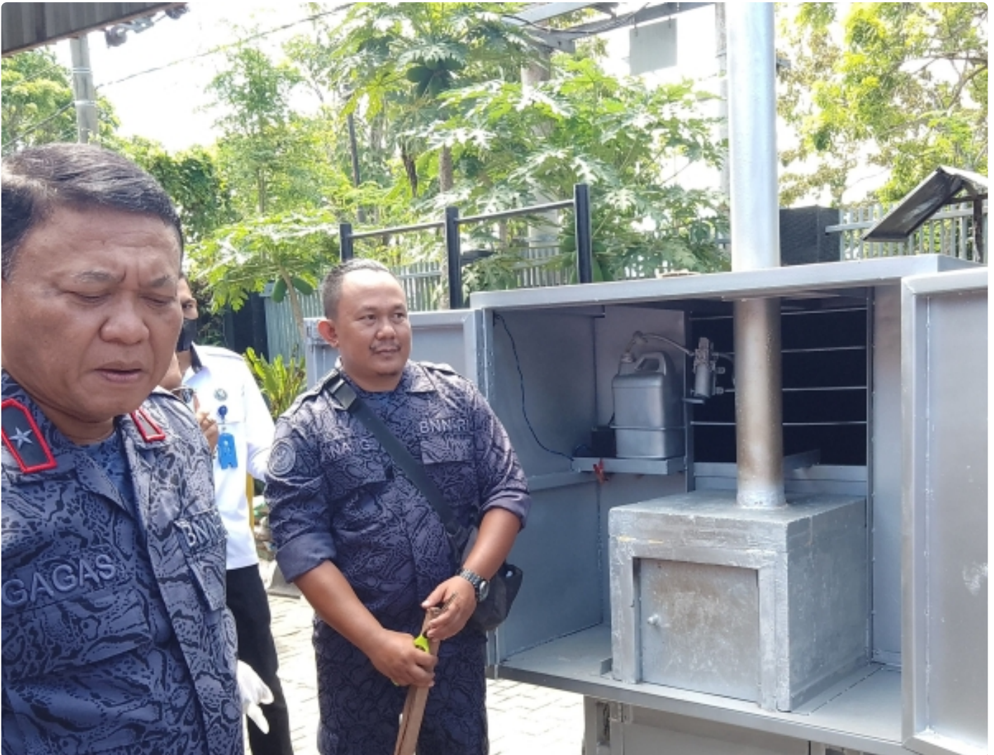
Kepala BNNP NTB saat pemusnahan BB sabu dengan mesin insenerator. (10/11)

Mataram NTB - Menindak lanjuti peraturan perundang-undangan terkait pemusnahan barang bukti narkotika yang disita dari hasil penindakan atas